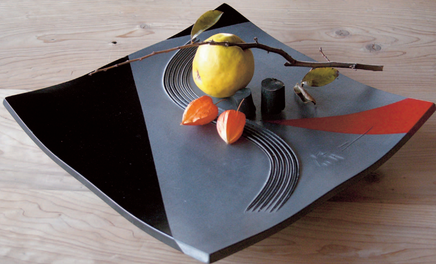
製作・撮影 山田脩二／いぶし焼成瓦盛り皿