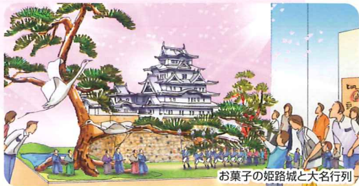
お菓子の姫路城と大名行列

お菓子でできた精密な「姫路城と大名行列」は、この博覧会のシンボル。「和のシンフォニー館」「和の匠館」には、技を極めた菓子工芸作品が展示されます。お菓子とは思えない美しさを、あなたの目で確かめてみませんか?