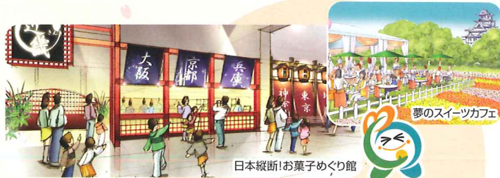
日本縦断!お菓子めぐり館