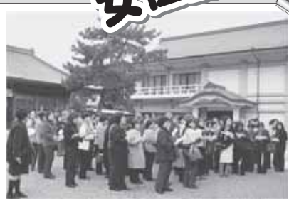
淡路島再発見の一日バスツアー