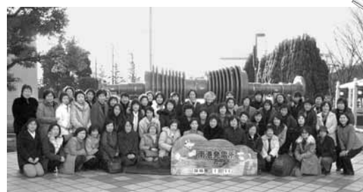
えびす参拝視察旅行