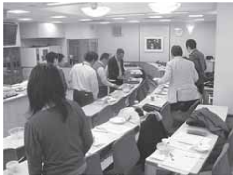
育成調理師専門学校での特産品開発をした試食風景