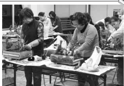
寄せ植え&フラワーアレンジメント講習